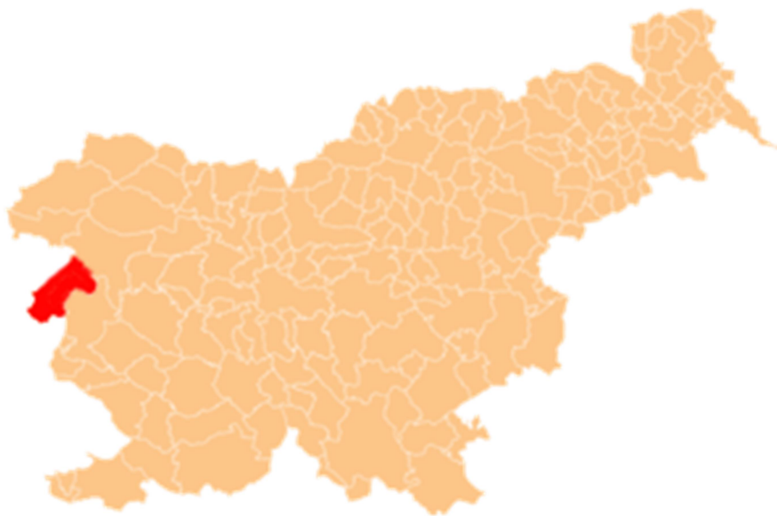
Slika 2:lega Goriških Brd na zemljevidu

V zgodovini so Brda pripadala rimskemu imperiju, pozneje Habsburžanom, po drugi svetovni vojni pa so bila razdeljena med Italijo in Jugoslavijo. Danes predstavljajo simbol kulturne raznolikosti in čezmejnega sodelovanja. Zaradi naravnih lepot, tradicije, kulinarike in prijaznih domačinov so Goriška Brda priljubljena turistična destinacija, ki obiskovalcem ponuja avtentično doživetje slovenskega podeželja.