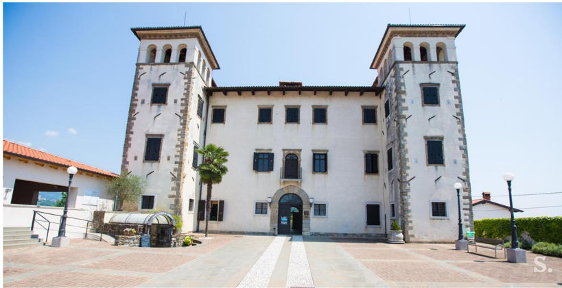
Slika 9: grad Dobrovo