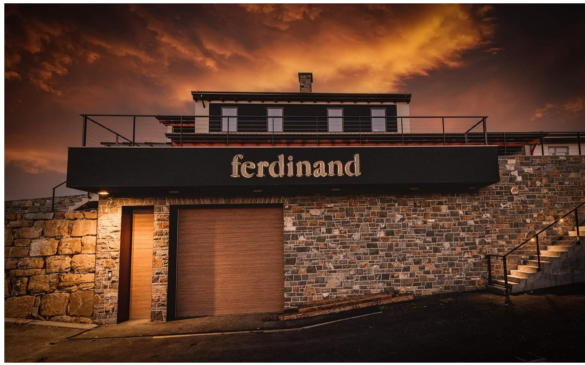
Slika 7: Ferdinand winery