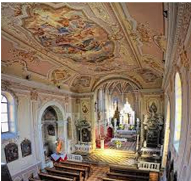
Slika 8: župnijska cerkev sv. Mihaela