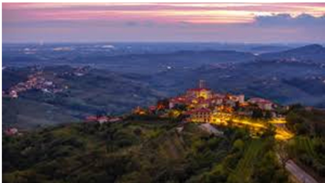
Slika 1: Goriška Brda