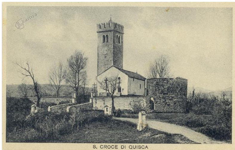
Slika 3: Zgodovinska slika cerkve

množice, ki pridejo doživeti pristno briško vzdušje. Danes Brda predstavljajo simbol prepleta slovenske in italijanske kulture, miru, vztrajnosti in bogate zgodovinske dediščine.