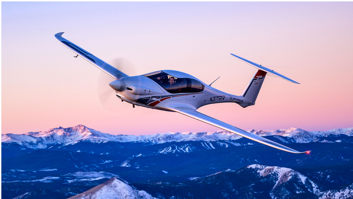
Slika 10: letalo Pipistrel

Zmagovalec v pobiranju grozdja se pripravi za krajšo panoramsko vožnjo.