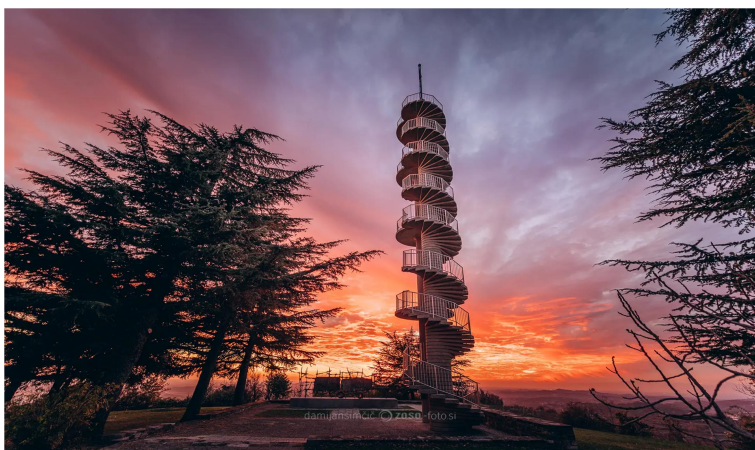
Slika 6: razgledni stolp Gonjače