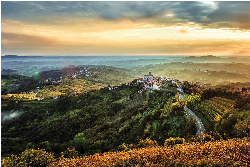
Slika 11: Goriška Brda

Prijaznost domačinov, mirno vzdušje in naravna lepota bodo poskrbeli, da bo izlet nepozaben. Goriška Brda nam bodo ostala v lepem spominu kot destinacija, kamor se bomo z veseljem še kdaj vrnili.